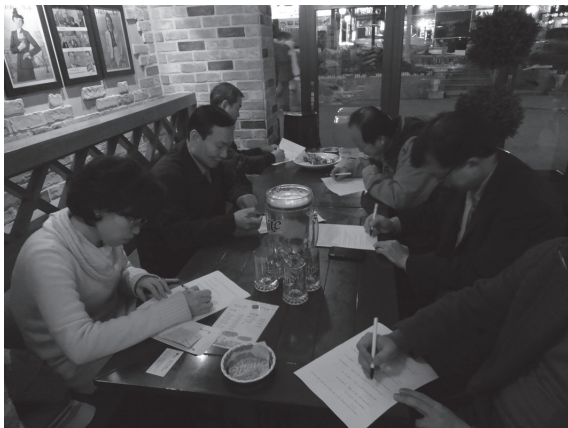
<写真1> 大丘市内のある居酒屋で宴会を始める前にアンケートを作成している調査対象者

本研究は、社会言語学的な調査であるため、既婚男女を調査対象に、夫婦間の呼びかけ表現だけでなく、本人や配偶者の社会的属性に関する情報(年齢・職業などの個人情報)についても尋ねざるをえなかった。