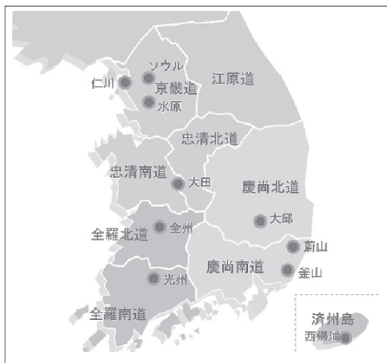
<図2> 韓国の全国地図

本調査では、韓国人の夫が妻に対する呼びかけ表現を選択・決定する際の主な要因について夫婦の特性などから多角的な分析を試みた。ここでは、地域差に焦点をあて、分析を行う。韓国社会では、一般に、慶尙道(慶尙南道・慶尙北道、<図2>参照)出身の男の人は無愛想で妻や恋人に対し愛情表現があまりできないと言われているが、慶尙道出身の夫と他地域出身の夫が、それぞれどのような呼びかけ表現で妻に呼びかけるかを見てみよう。場面による分析と同じく、30代から40代の夫が妻に対し、2人きりの場面にもっともよく使う呼びかけ表現を分析対象にする。