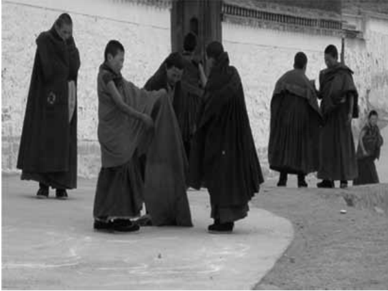
授業を終わって外で遊ぶ小僧侶達