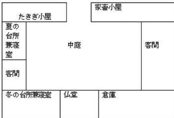
図2 1989年建てた調査村の家屋の図

屋とテント（現在簡単な家型テントになっている）を持っている。しかし、村人のほとんどは集落の固定した家屋で生活をしている。草原では各家族一人しか住んでいないので、本論では集落の定住家屋の変遷を紹介したい。