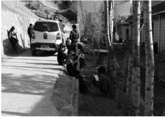
勉強している調査村の中学生達