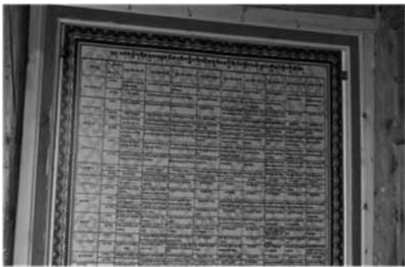
カッシツエ寺全クラスの年間授業目標掲示板