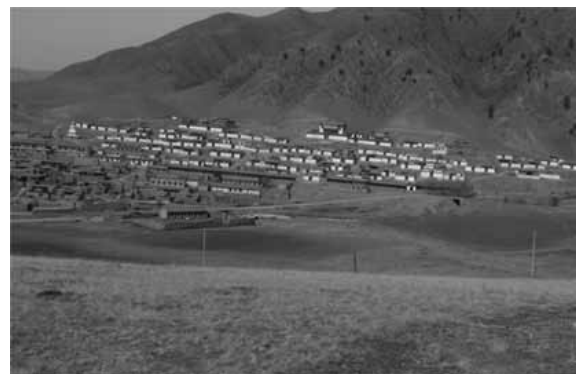
調査村のカッシュツエ寺

ラブラン寺では聞思学院（仏教の理論や哲学、弁証法を勉強する）や密教学院、天文学院、医学院など四