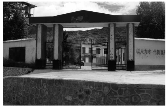
調査村が属する双朋西郷政府

1955 年同仁県も中央の農牧畜の政策に従って、農牧畜の互助組を実行した。互助組というのは、村の 3、4 戸が一つのグループになって一緒に労働する仕組であった。資料によれば、1955 年黄南チベット族自治州で互助組政策を行って、その年の全州の食糧総産量は 1954 年の 744.15 万キログラムから 1547.15 万キログラム、107.91% の増加となった。（『黄南チベット族自治州誌』 pp106）