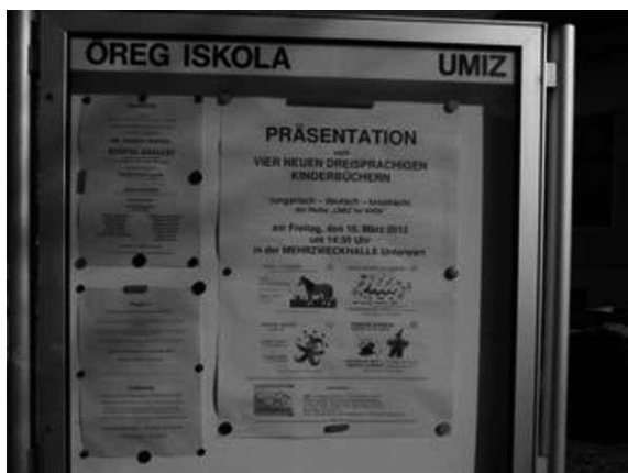
“UMIZ for KIDS”で作られた子供たちによる3言語での絵本発表会案内 (2012年3月16日開催) 19)