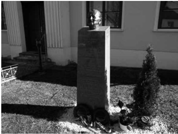
UMIZ 前のガランボシュ牧師の彫像

ターヴァルトのカトリック・ベネディクト派教会の牧師ガランボシュ・フェレンツ (Galambos Ferenc, 1920-2007) が尽力した。