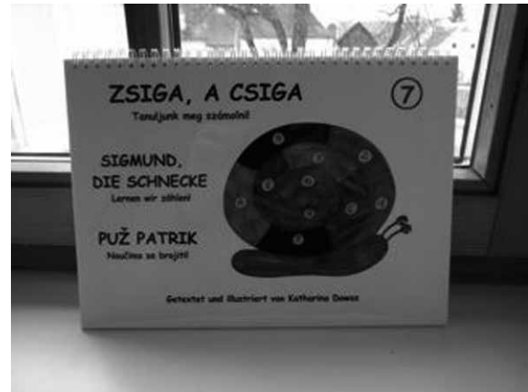
“UMIZ for KIDS”で作成された絵本。ハンガリー語、ドイツ語、クロアチア語で書かれている

オーバーヴァルト、ウンターヴァルト、シゲト・イン・デア・ヴァルト 15) における郷土史の資料収集を行なっている。書籍、出版物のみならず、現地の古い写真や絵葉書、手書きのものなども郷土史の対象として集めている。コレクションには2,500枚もの古い写真があり、これらはウンターヴァルト郷土史博物館が保管する。