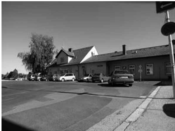
オーバーヴァルト旧駅舎