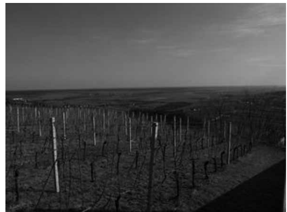
アイゼンベルクの葡萄畑。すぐ向こうはハンガリー